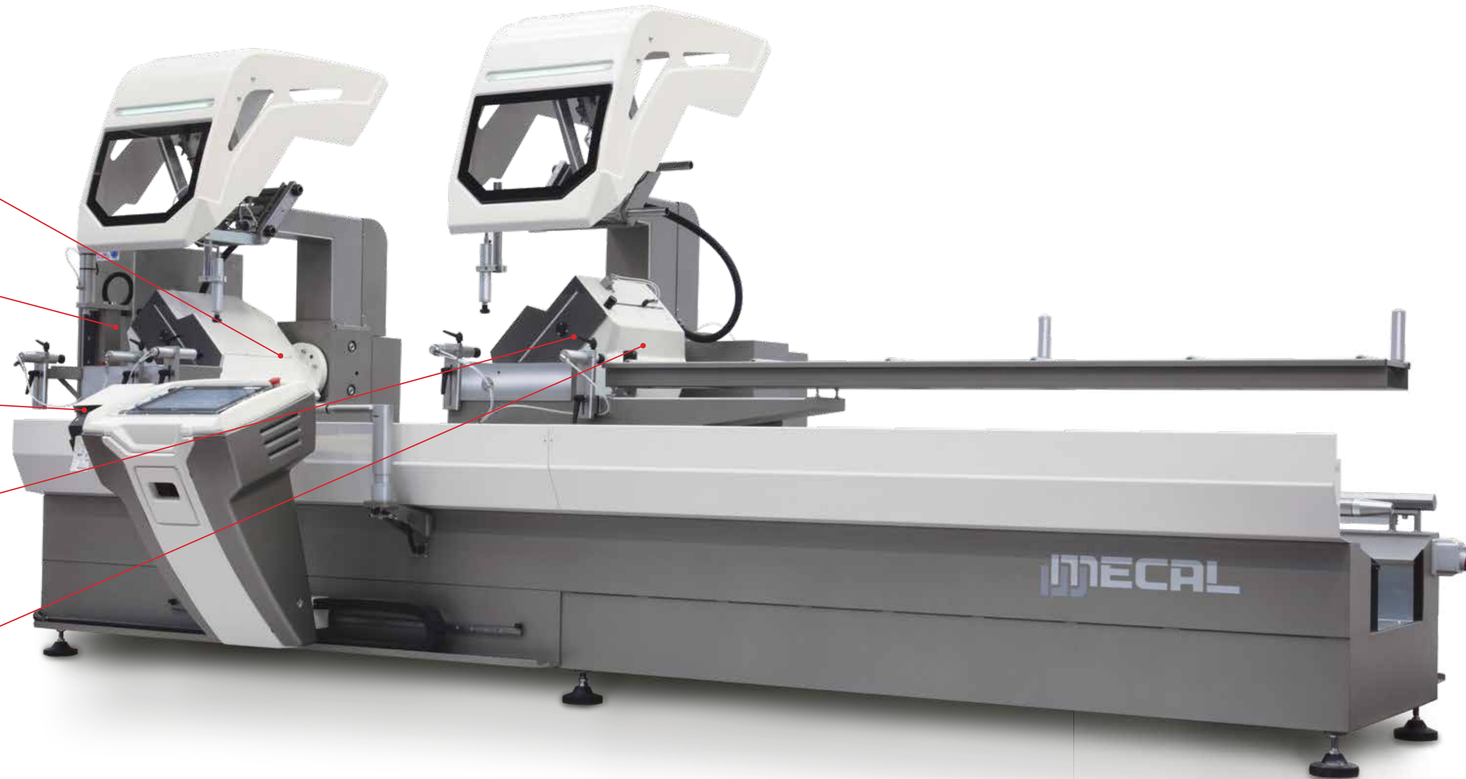
SW 553 Hoja/Disco Ø 550 mm